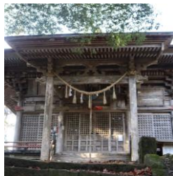
華足寺の本堂である馬頭観音堂

若草神社では大晦日の22時頃頃から八若会氏子青年部(地元の皆様)で、そばや玉こんになどを提供するほか、甘酒を無料で振舞うことにしています。 さらに、若草崇敬会(ライダーの皆さん)では、年明けから日本酒の鏡開きをして、振舞うとのこと。 また、今回で8回目となる五社参り(若草神社のほか、津島神社、登米神社、杣荷神社、豊里の豆から稲荷)が1月1日から3日迄、1月10日から12日迄行われ、御朱印集めの皆様には見逃せない企画となっています。 正月飾りなどの焼納を行うどんと祭については、1月14日(水)午後7時からの神事に引き続いて点火し、この際には神社から鯛汁を振舞うということです。 なお、どんと祭で正月飾りなどを燃やす際は、