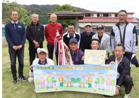
連覇を果たした6区の皆さん