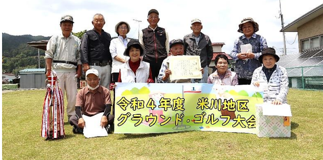
令和4年度 米川地区 グラウンド・ゴルフ大会